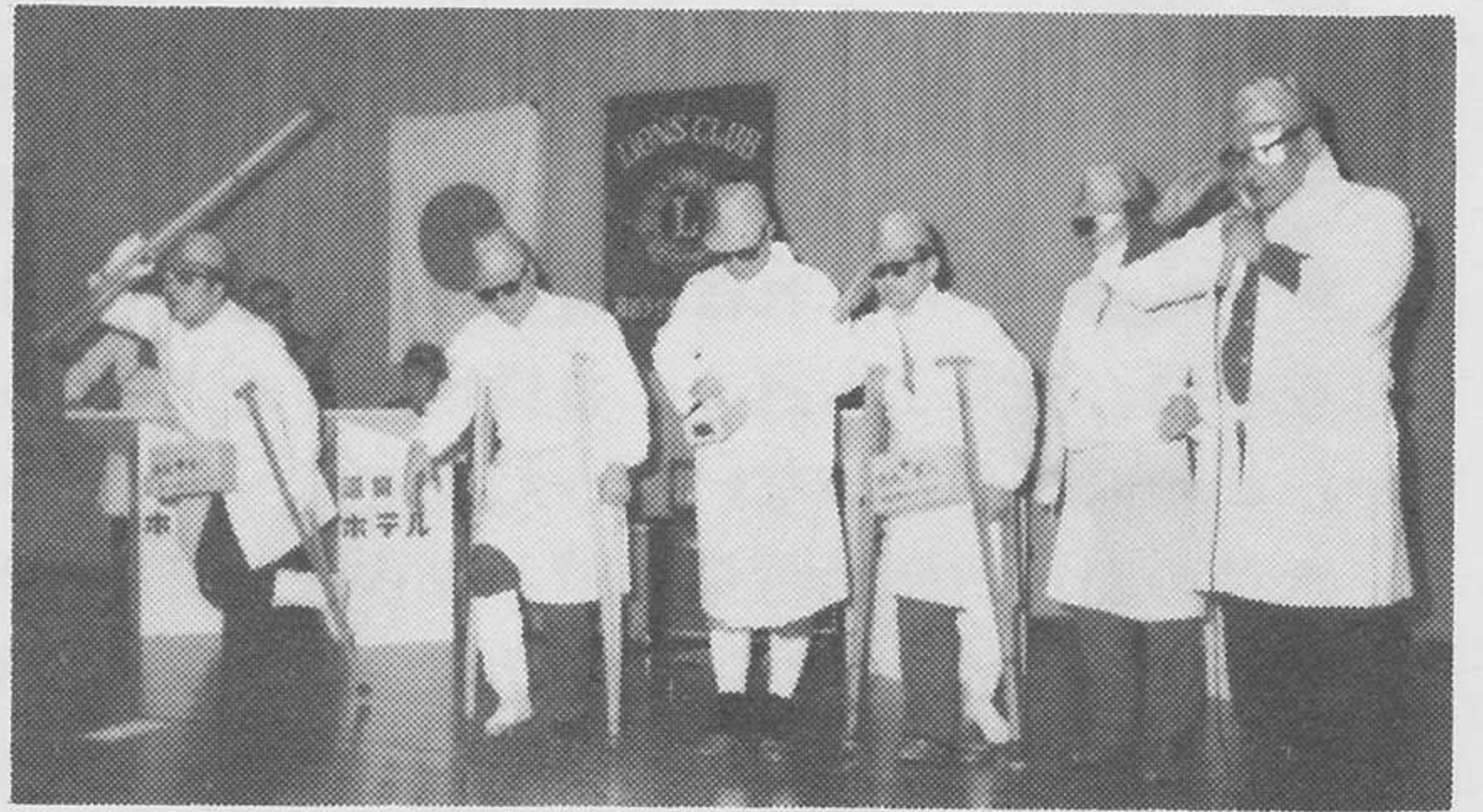
倉吉打吹L C 白衣の勇士 努力賞