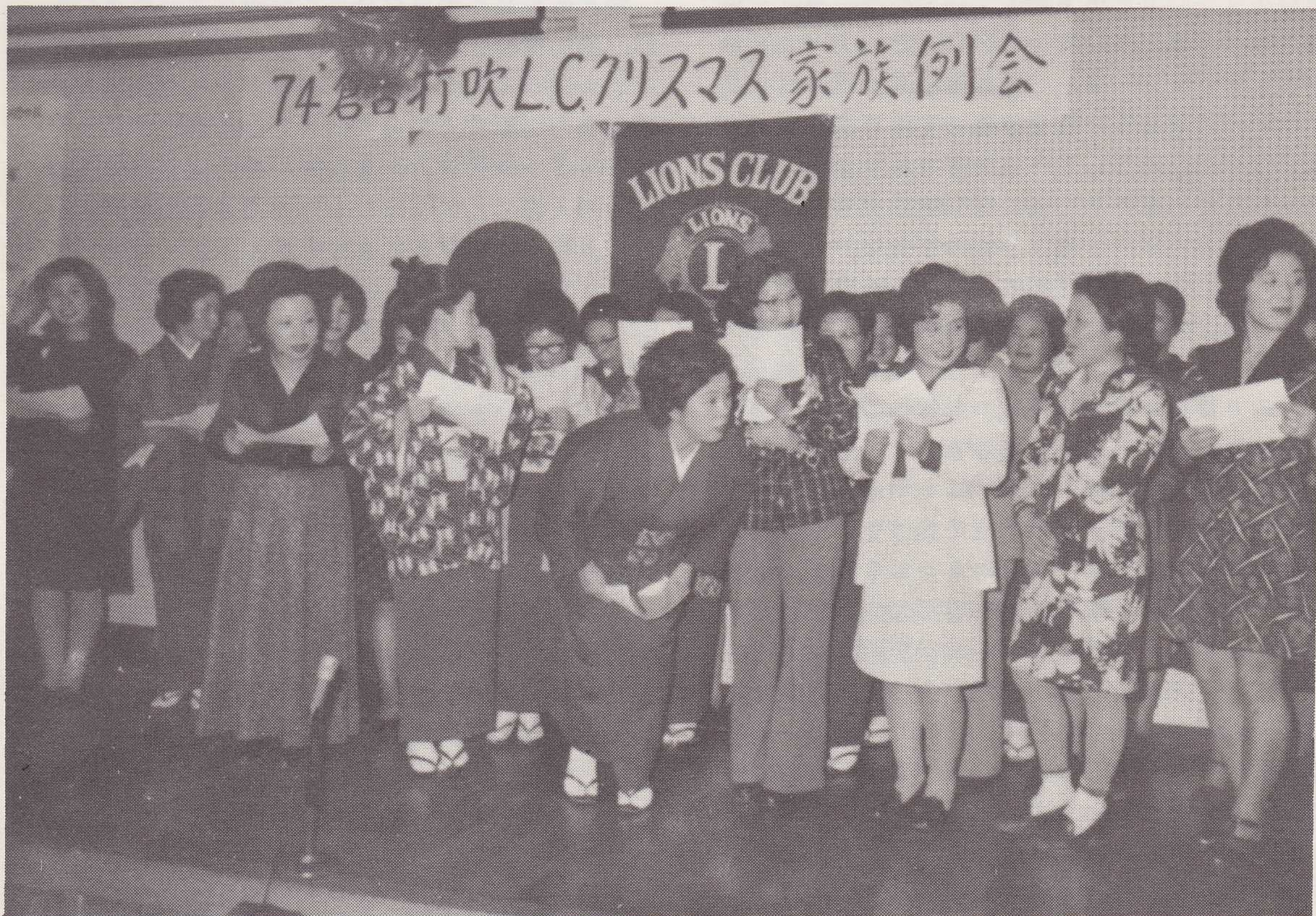
クリスマス家族例会