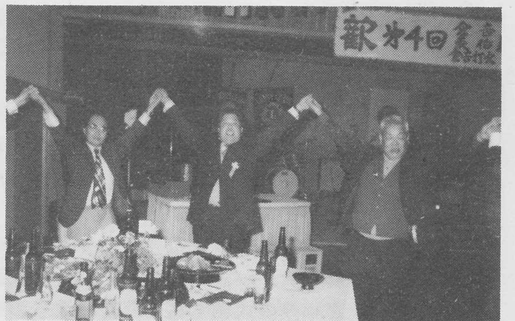
またあう日まで (倉吉打吹L C ライオンズ情報委員会)