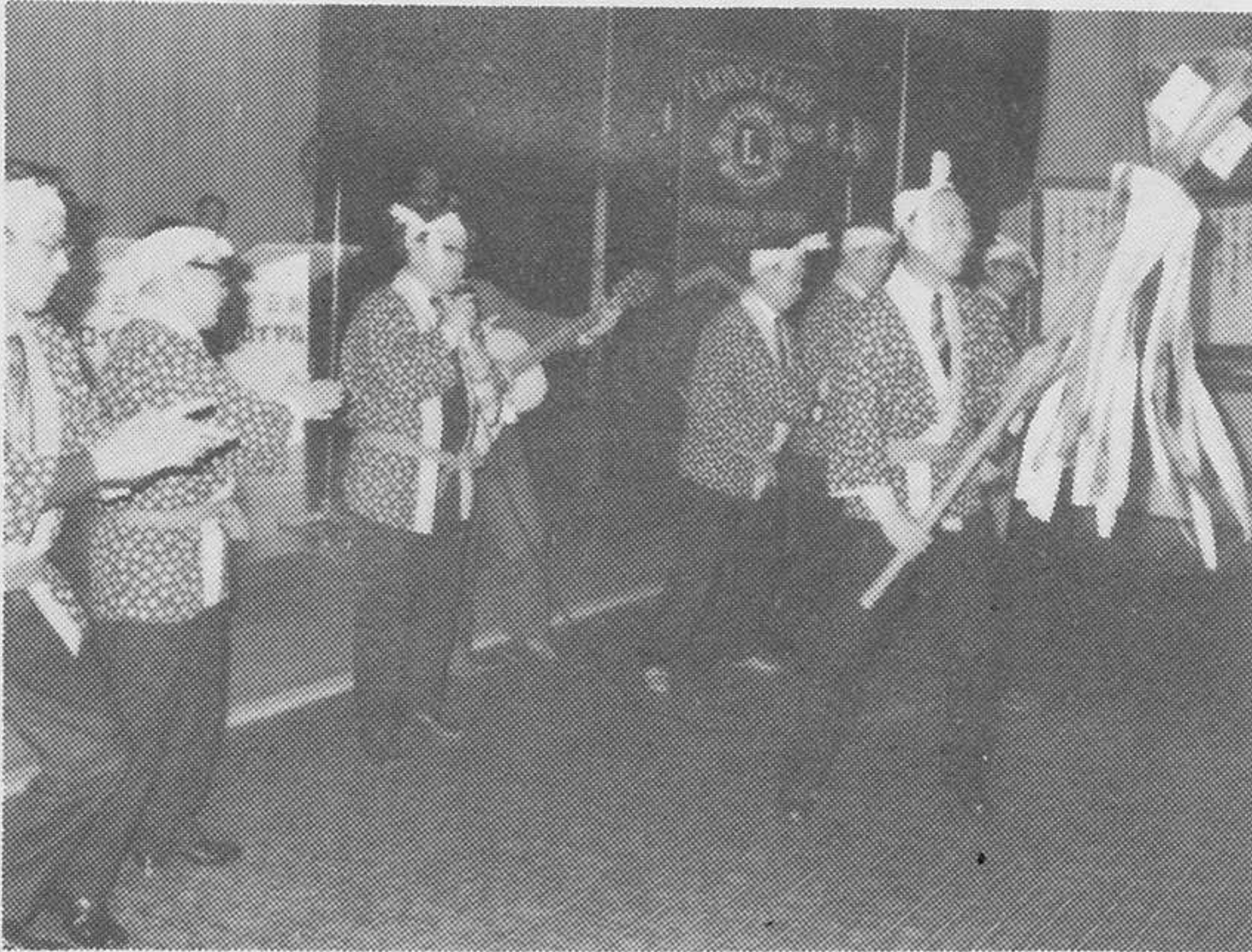
倉吉L C きやり 敢斗賞

キャンドルに灯をてんじて、音楽に乗って「ライオンの光」"1本の明かり、1本の小さな明かりそれはわずかに……"と流される。