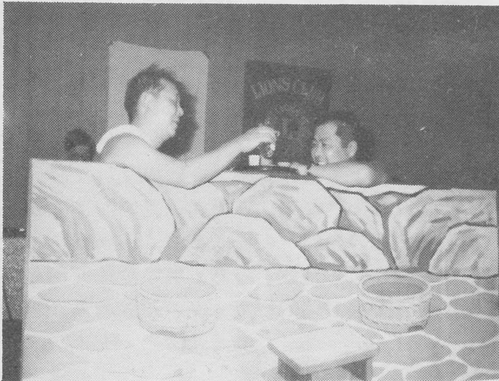
東伯L C 好い湯だな 技能賞