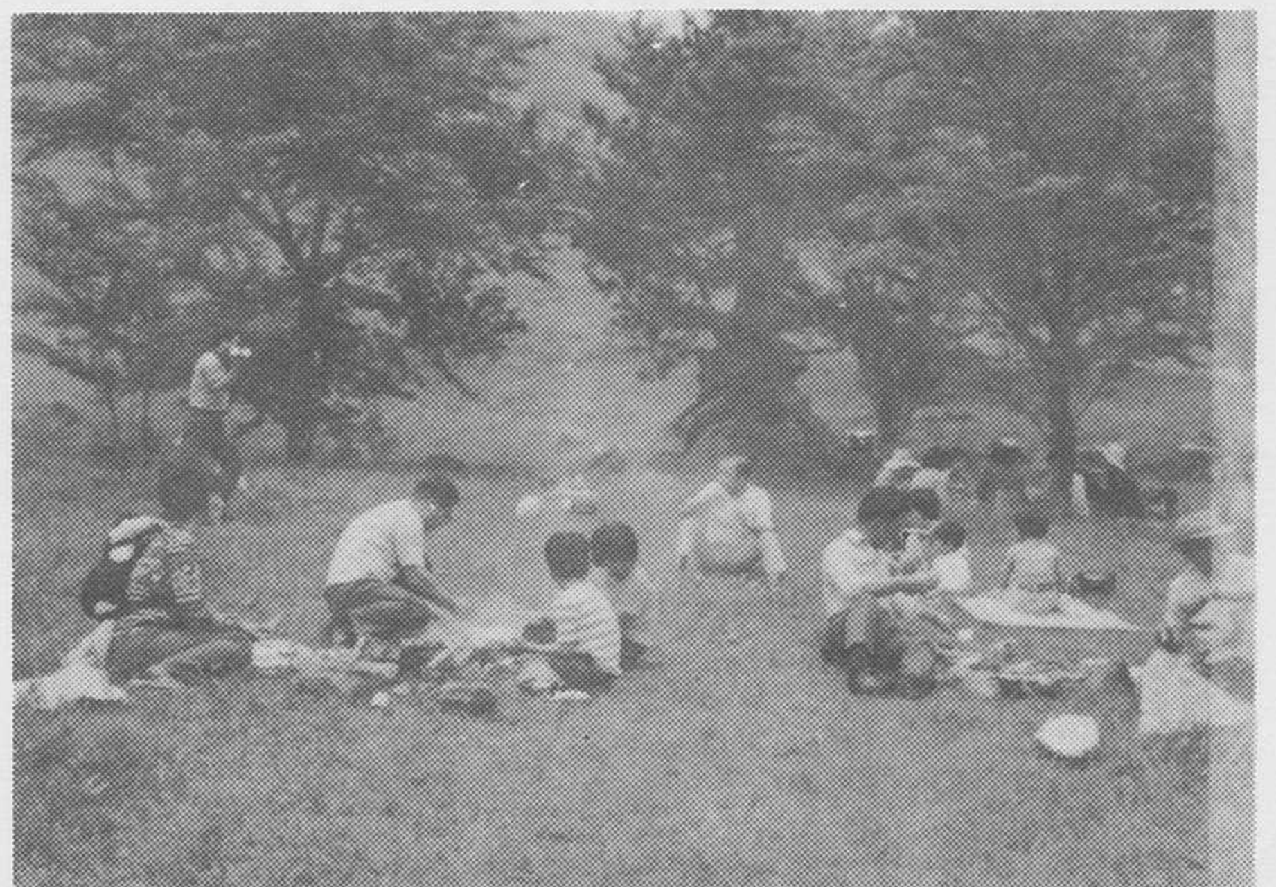
春のエクスカーション